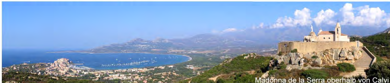
Madonna de la Serra oberhalb von Calvi