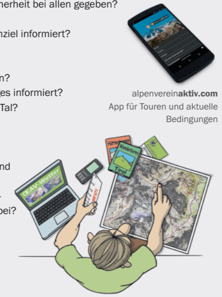
alpenvereinaktiv.com App für Touren und aktuelle Bedingungen

Faustformel zur Berechnung der Gehzeit (einer mittelgroßen Gruppe von 4 bis 6 Personen):