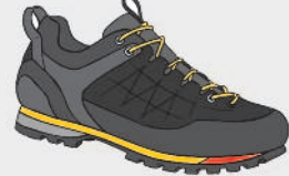
halbhoher Wanderschuh „Zustiegsschuh“