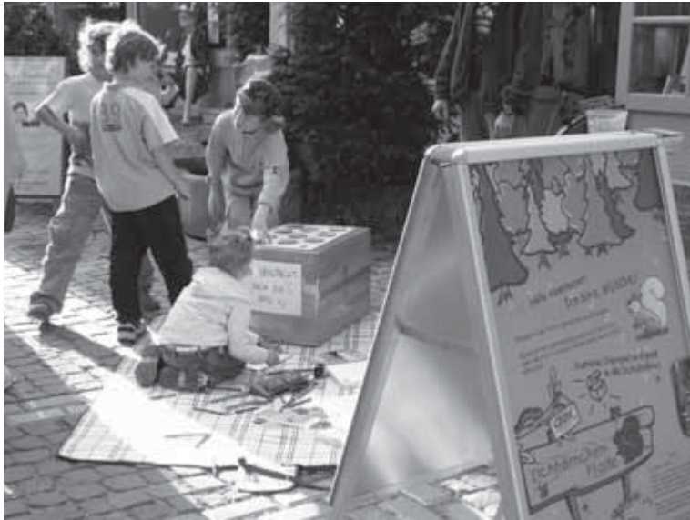
Spielplatz der „Eichhörnchen“ vor unserem Büro in der Brühlerstraße