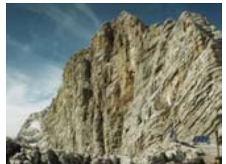
Blick von der Dachsteinwarte am Hoher Dachstein