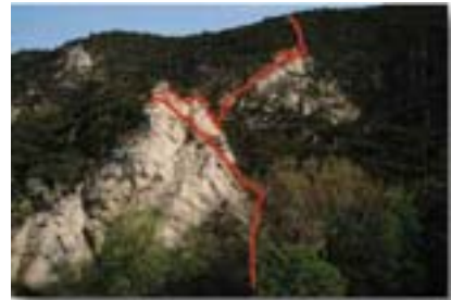
Klettersteig am Efeuhrad in der Mödlinger Klausen

Klettern! Hier stellt sich die berechtigte Frage warum? Die Antwort stark vereinfacht: Es fehlt das dehnbare Seil und die sogenannte dynamische Sicherung. Durch eine entsprechende Klettersteigausrüstung, die dann auch noch richtig verwendet wird, können die Probleme am Klettersteig mit den hohen Sturzkraften minimiert werden.