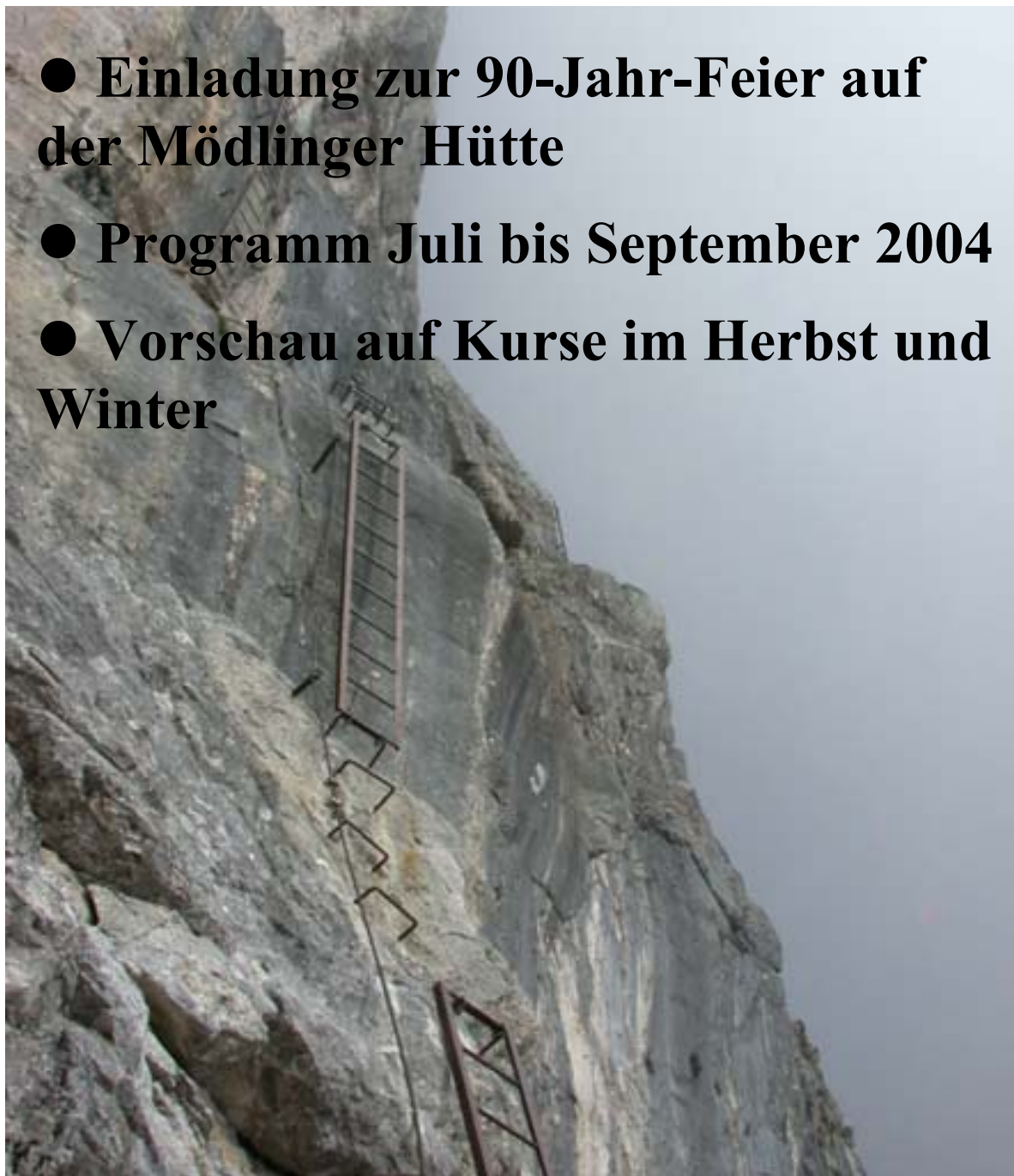
Großer Priel; B.Rinesch-Klettersteig C/D (Sommer 2003)