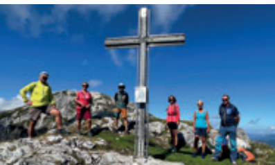
Bike & Hike Grabnerstein

Hinweis: Die OG Oberzeiring und alle genannten Tourenführer freuen sich über die rege Teilnahme aller Mitglieder der Sektion, auch wenn sie nicht direkt bei der Ortsgruppe gemeldet sind.