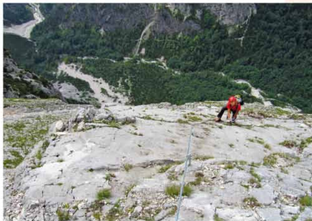
Flache Platte im oberen Teil