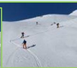
12.2. Hintergullingspitz und 5.3. Rumpflerrunde

Obwohl eine längerfristige Vorausplanung in dieser Zeit kaum möglich war gelang es uns sobald sich Fenster im Durcheinander der Pandemie öffneten wieder Veranstaltungen anzubieten, welche von unseren Mitgliedern Dank ihrer Flexibilität und Treue auch gerne angenommen wurden. Ich möchte mich an dieser Stelle hierfür nochmals eindringlich bedanken.