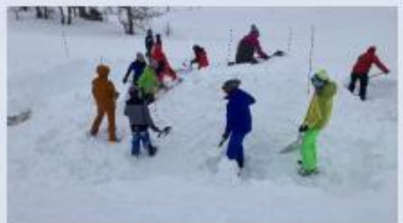
Alle heifen kräftig mit

Somit war die Sache klar, wir wagten den Versuch, auf die Gefahr hin, dass wir nach kürzester Zeit das Projekt abbrechen müssten.