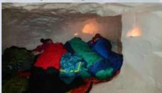
Eines der drei „Schlafzimmer“

Nachdem am Abend alle wieder aufgewärmt, gestärkt waren und trockene Kleidung gegen die durchgeweichte eingetauscht hatten, machten wir uns mit Isomatten, Schlafsäcken und Kuscheltier auf in unsere Iglusiedlung.