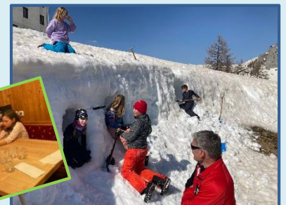
März 2022 Kinder- und Jugendschiwochenende Tauplitzalm