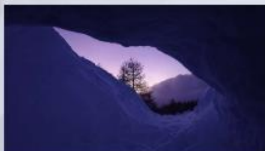
Der Blick am Morgen aus dem Iglu.

Alle verbrachten anfangs die Nacht in den Iglus. Nach und nach suchte einer nach dem anderen die Bergrettungshütte auf, um sich entweder aufzuwärmen, den Schlafplatz gegen ein warmes Bett einzutauschen oder für diejenigen die komplett die Nacht draußen verbrachten, das Frühstück zu richten.