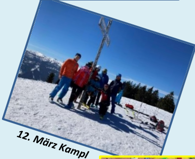
12. März Kampl

Ein kurzer Rückblick auf diese Funktionsperiode sei mir gestattet, war diese doch in vielen Hinsichten sehr ungewöhnlich. Als wir im Jänner 2020 unser Programm fertiggestellt hatten, dachte noch niemand daran was uns schon einige Wochen später an Absagen, Verschiebungen und Umbuchungen ins Haus stehen würde und dass dieses auch für gut 2 Jahre so bleiben sollte.