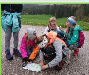
7. Mai Orientierungsrally