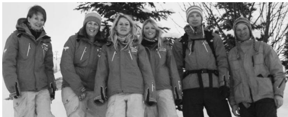
Das Team Wintersport blickt auf eine abwechslungsreiche Saison zurück.