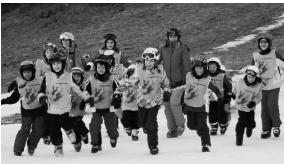
Die Freude am Wintersport steht bei unseren Kursen im Mittelpunkt.