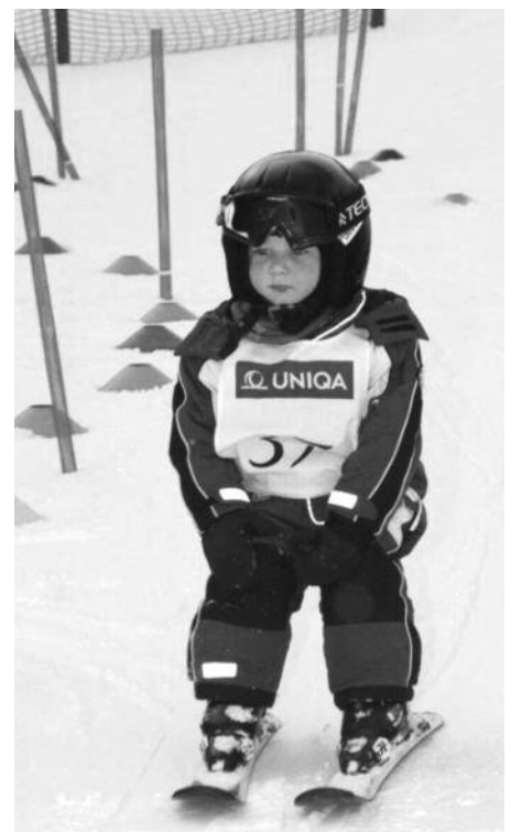
Auch die Jüngsten genossen die ausgezeichneten Schneebedingungen.