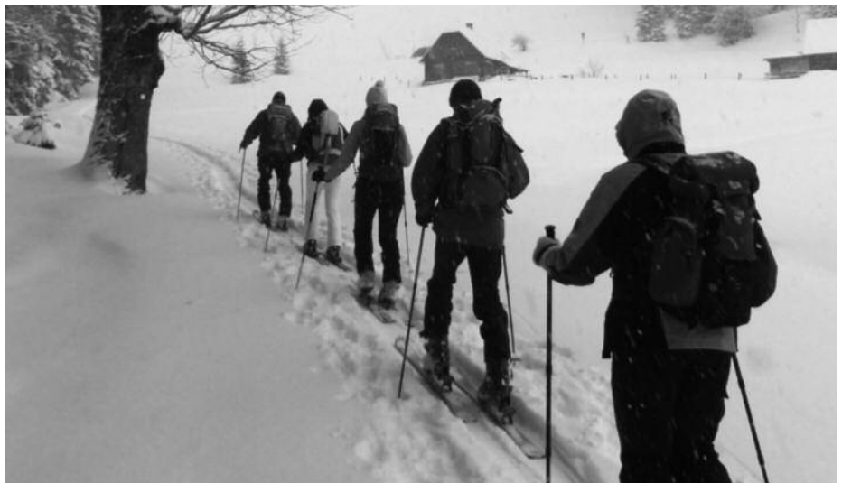
Schitour Lahnerkogel – bei der Fuchsalm