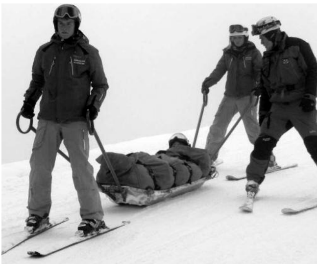
Ein Teil des Fortbildungsschwerpunktes: Erste Hilfe mit der Bergrettung Amstetten.