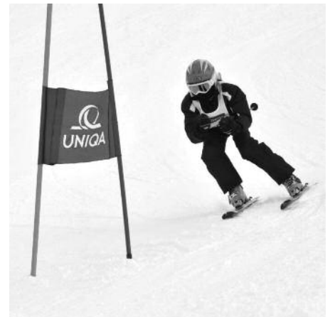
Beim Abschlussrennen gaben die jungen Skifahrer alles.

Im Februar stand mit der Familienskiwoche auf der Planeralm der zweite Saisonhöhepunkt am Programm. Die teilnehmenden Familien konnten bei viel Neuschnee eine abwechslungsreiche Wintersportwoche in der Steiermark verbringen. Während die Kinder und Jugendlichen von unserem Team in Ski-