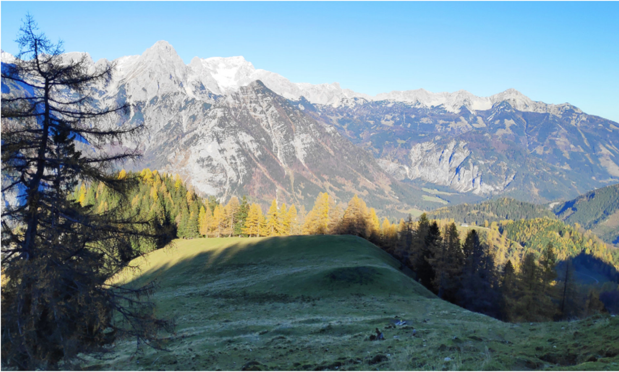
Ausblick zum Prielstock