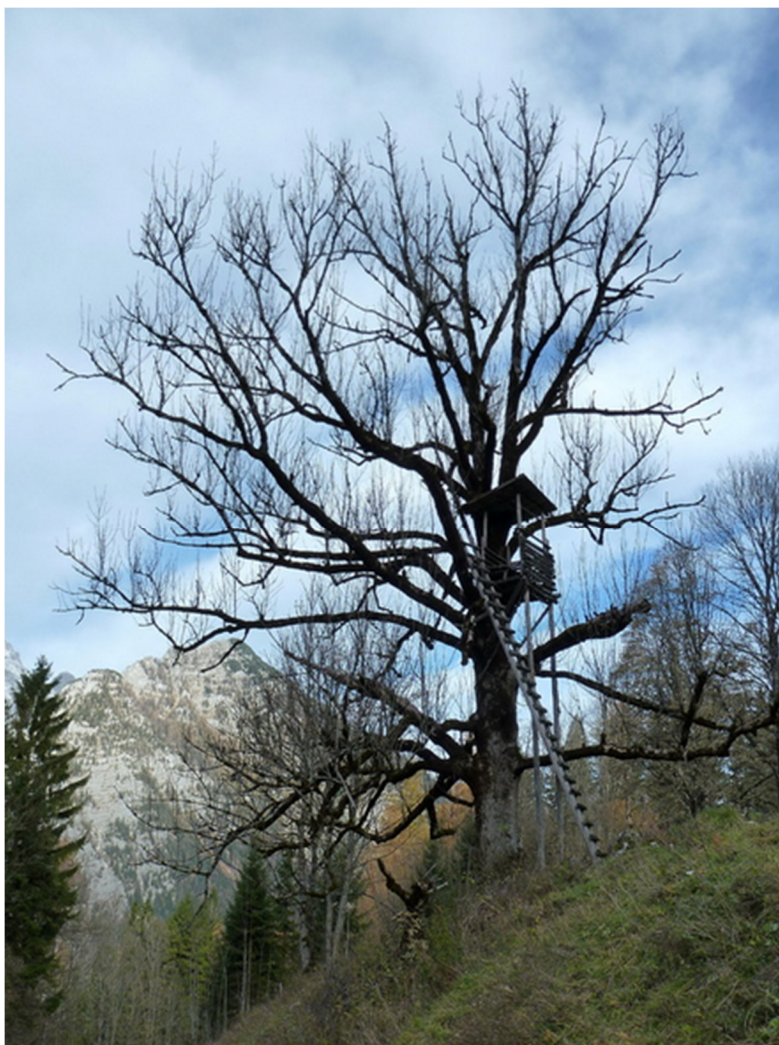
des Jägers Sitz