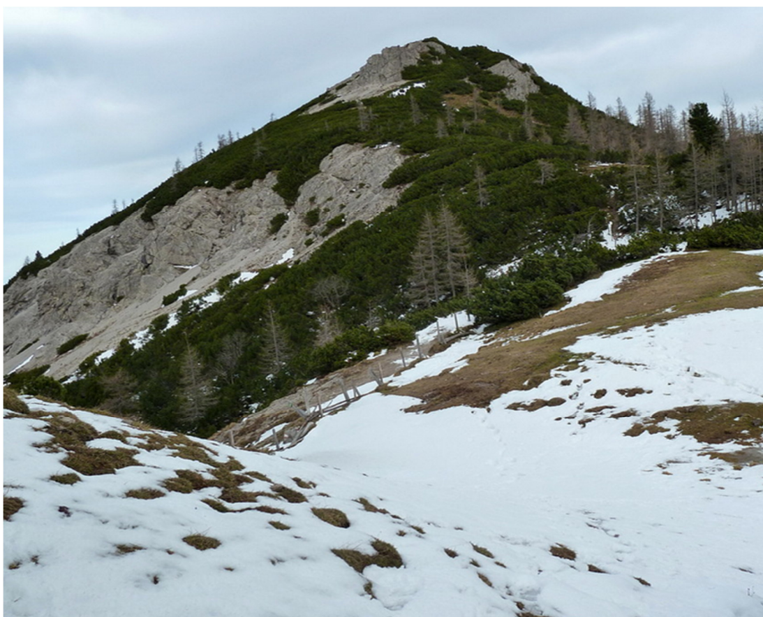
Türkenkarscharte auf 1.741 Meter