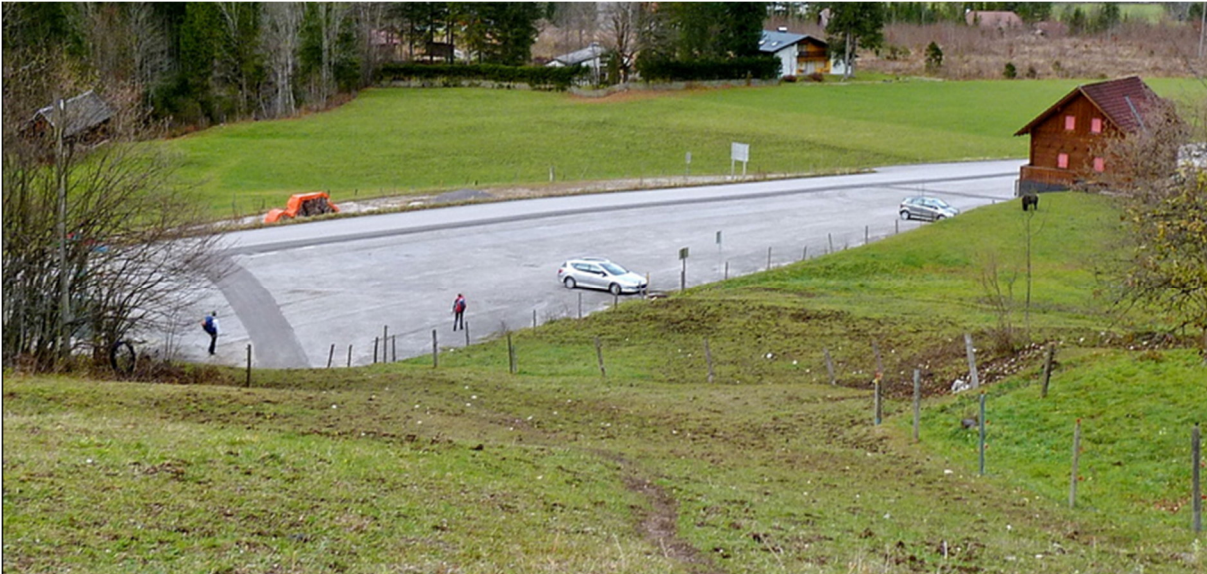
gebührenpflichtiger Parkplatz BÄRENALM