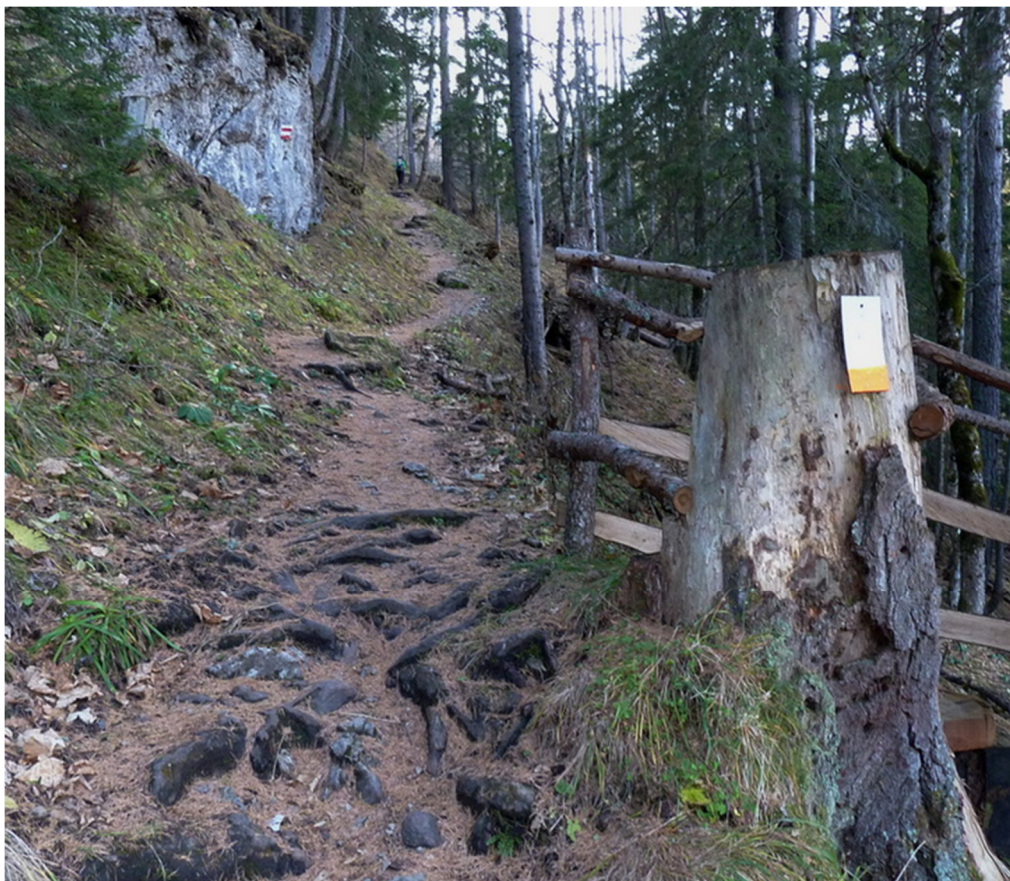
den Waldweg empor