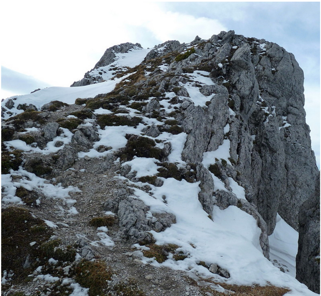
Gipfelaufbau zum Hirscheck 2.068 Meter