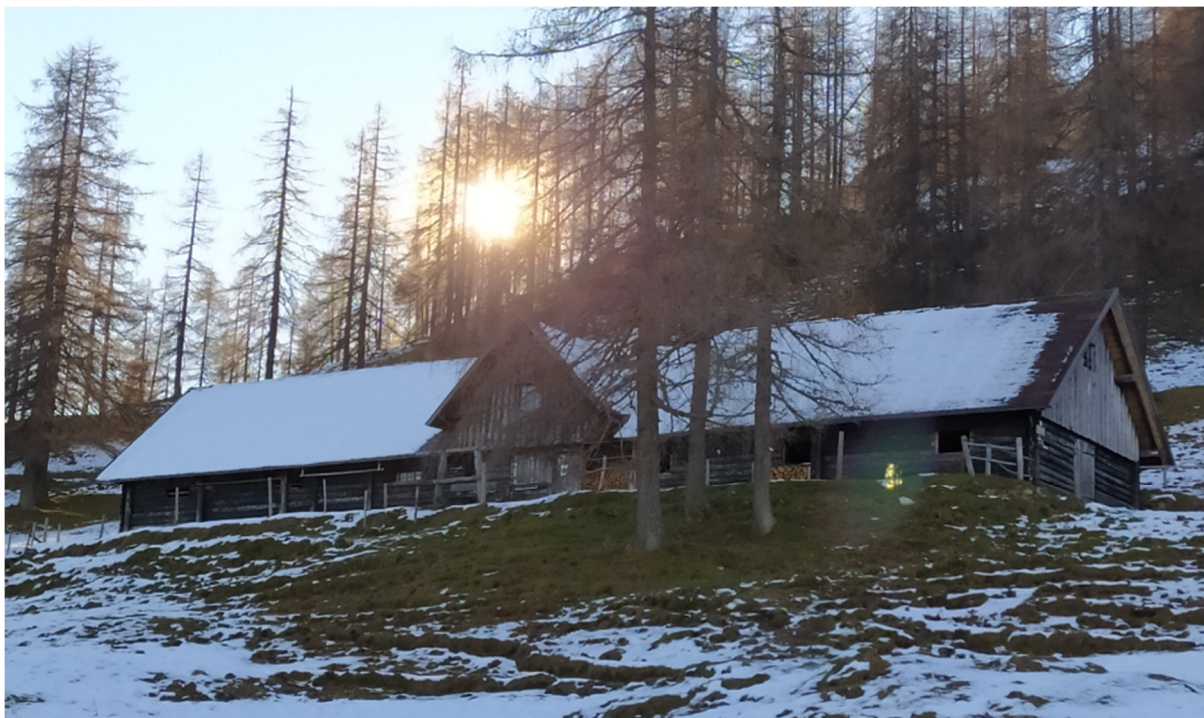
Bärnalm auf 1.626 Meter