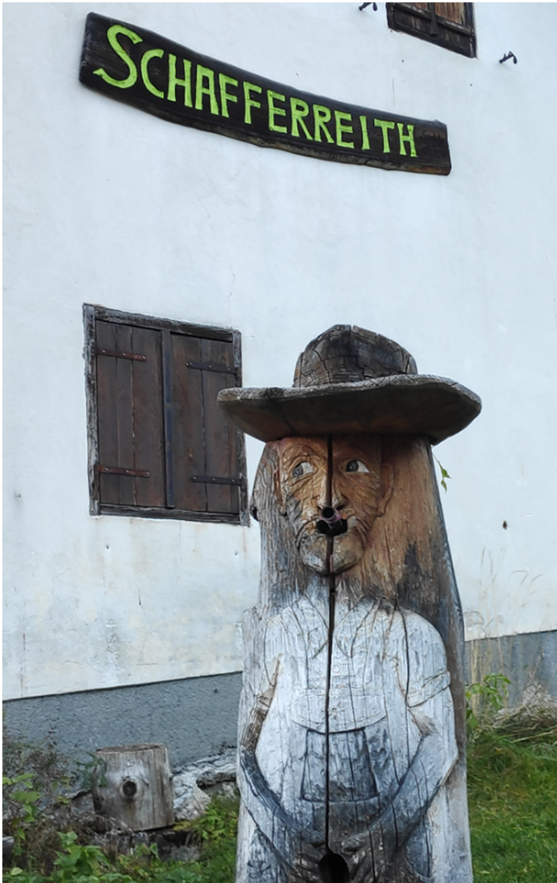
Labestation auf 1.055 Meter