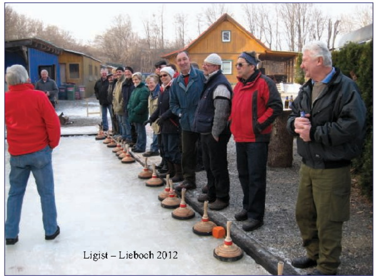
Ligist – Lieboch 2012