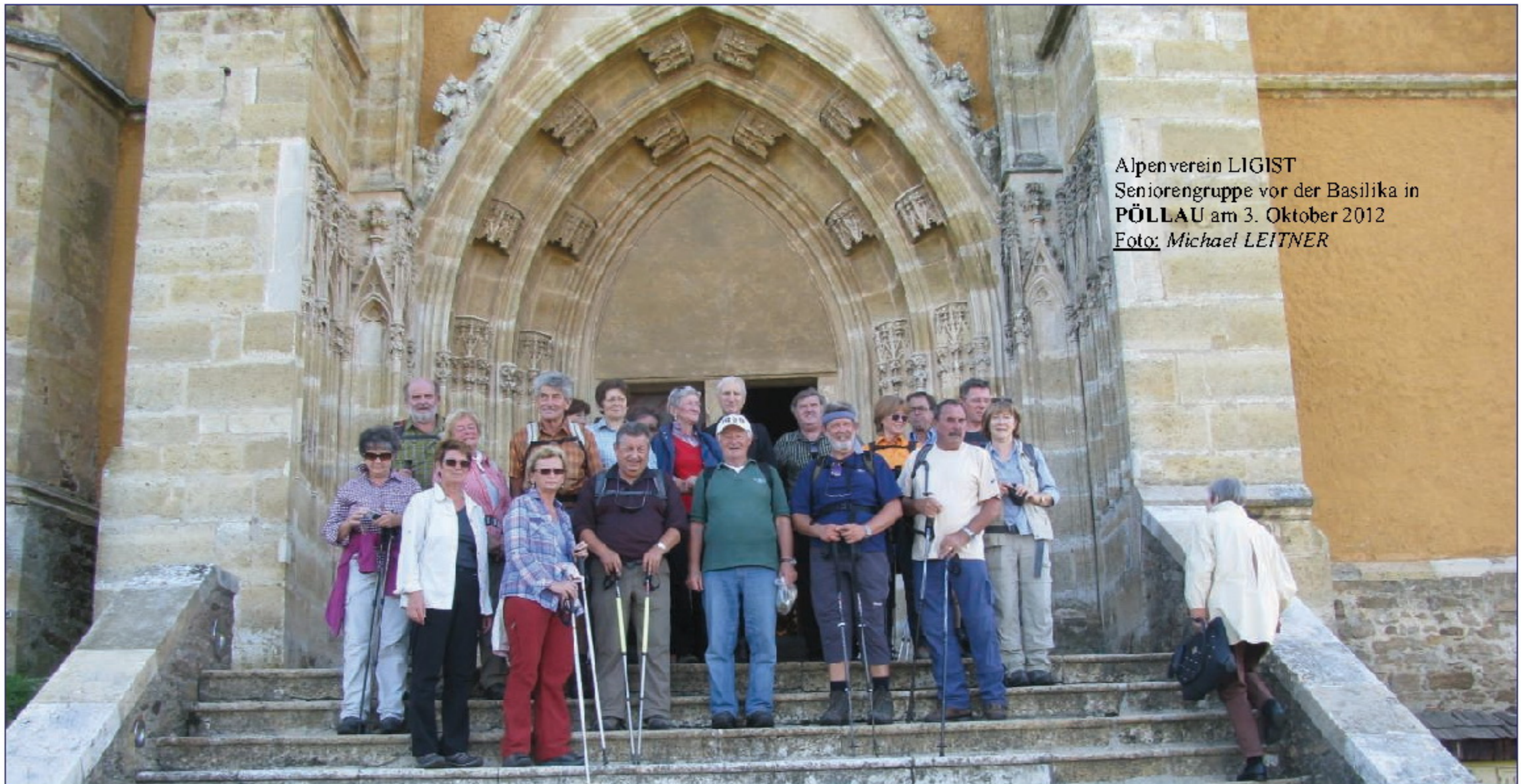
Alpenverein LIGIST Seniorengruppe vor der Basilika in PÖLLAU am 3. Oktober 2012

Samstag, 22. Juni: KLETTERSTEIG IN DEN KARAWANKEN mit Gerhard HAUSEGGER .