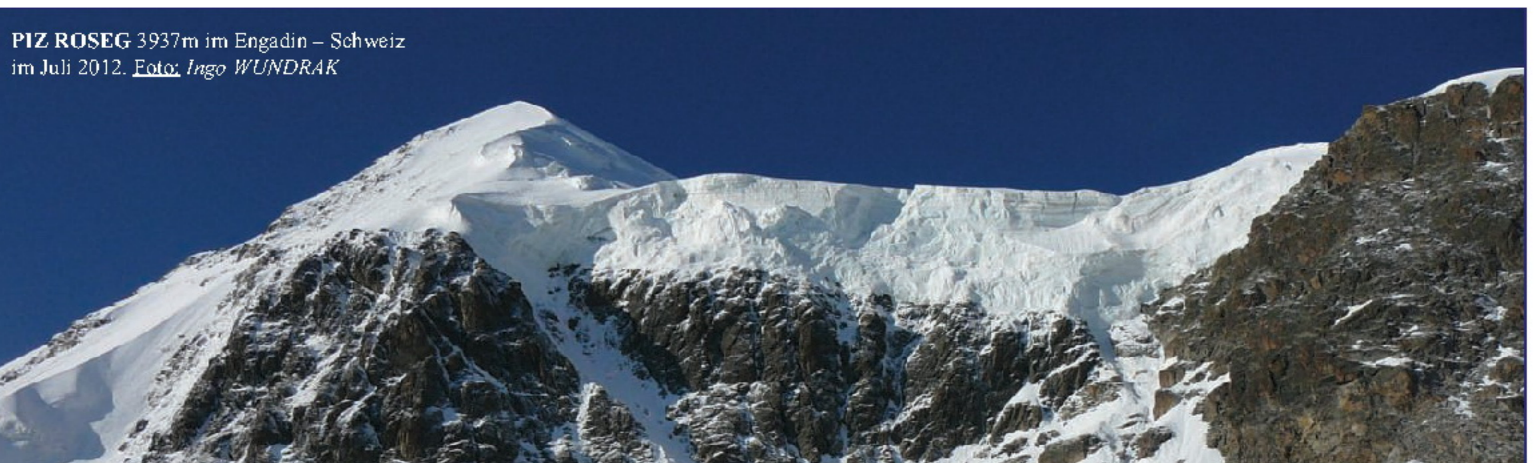
PIZ ROSEG 3937m im Engadin – Schweiz im Juli 2012.

Duisburgerhütte 2572m - Hannoverhaus 2719m mit Sepp EICHERL .