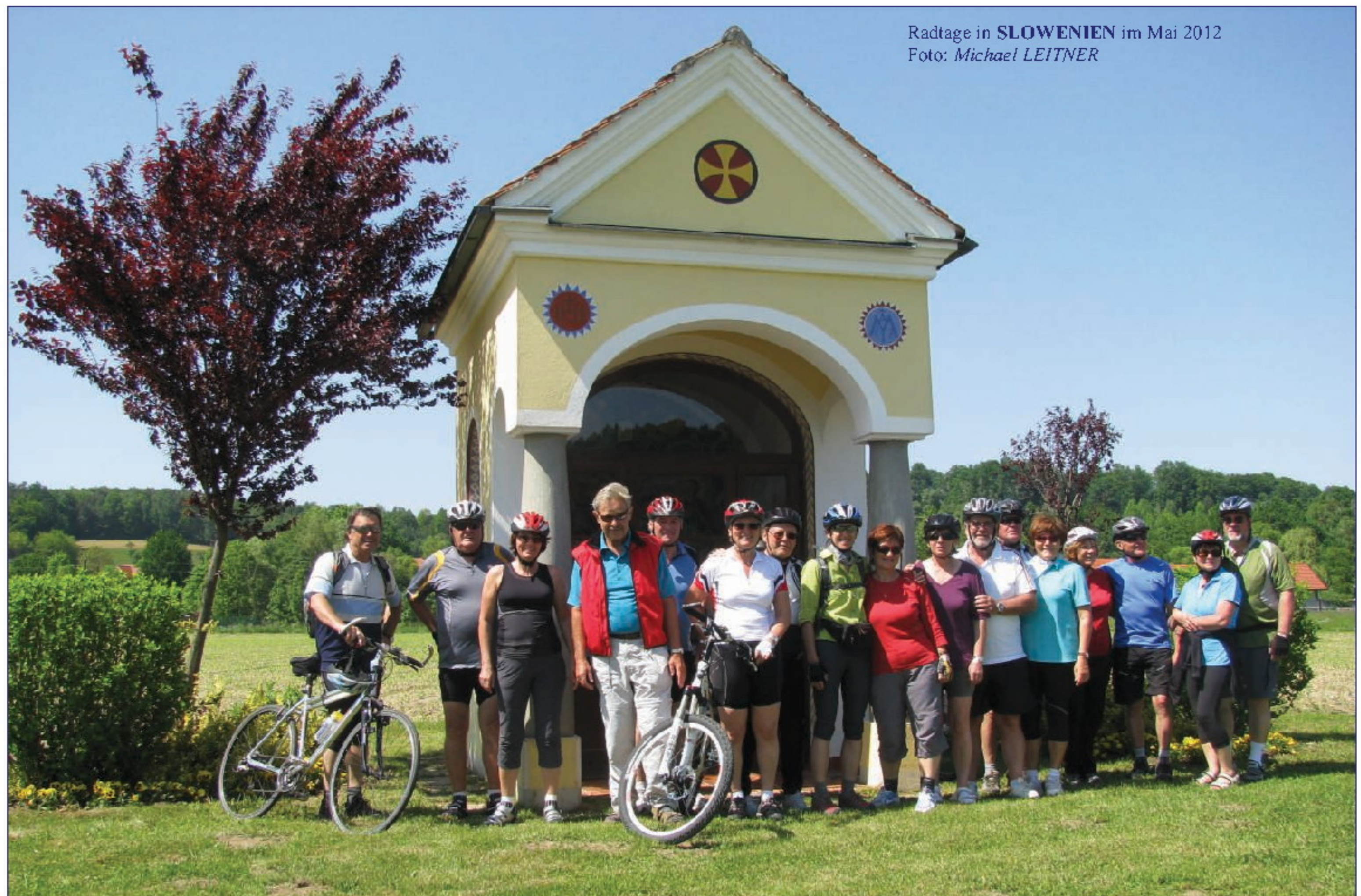
Radtage in SLOWENIEN im Mai 2012

Donnerstag - Fronleichnam, 30. Mai bis Samstag, 1. Juni: RADTAGE IN UNGARN mit Unterkunft in Mosonmagyaróvár. Organisation: Fritz ROTHBART .