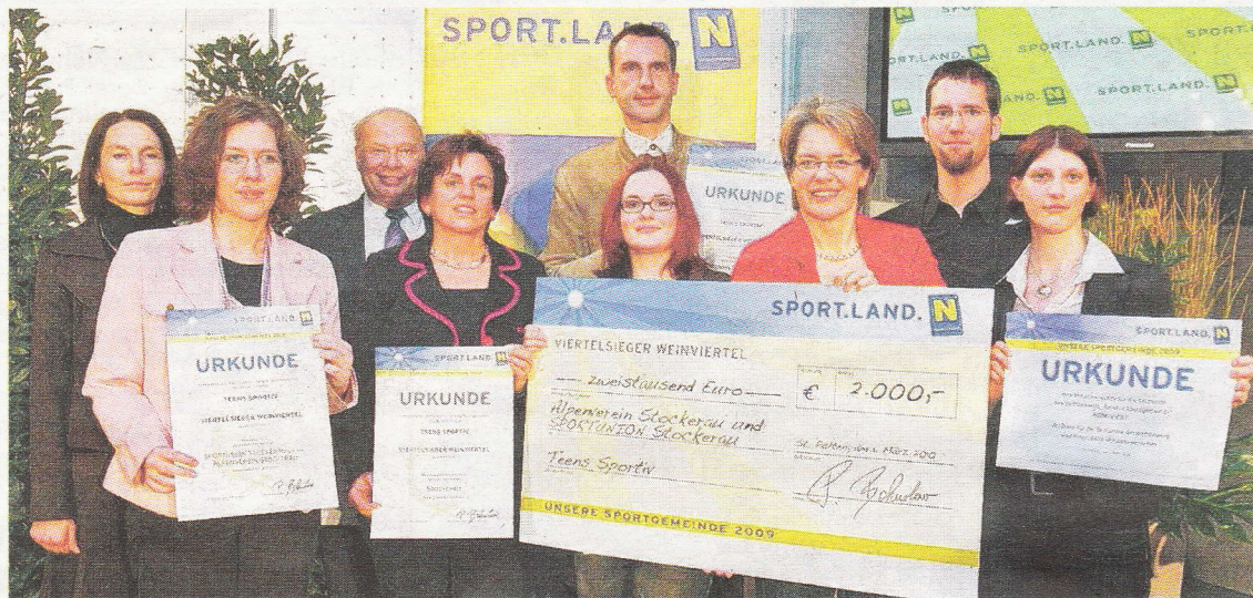
Die Weinviertel-Siegergemeinden, unter denen sich auch Stockerau mit dem Alpenverein und der Sportunion befindet, bei der Siegerehrung zur NÖ Sportgemeinde.

Die Auslosung für alle drei Turniere findet in Bisamberg am 5. März, um 18:30 Uhr, im Landgasthof Bisamberg im Beisein von Prominenz aus Fußball, Sport und Politik statt.