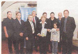
Die Auslosung der Turniere findet in Bisamberg statt.